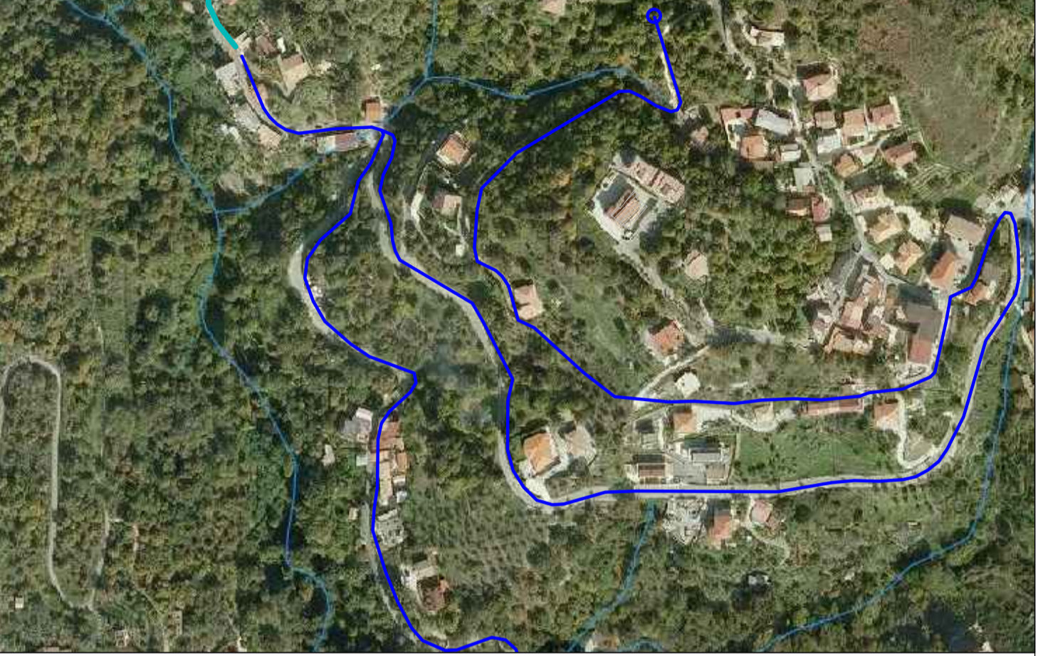
Planimetria Fognatura di Progetto Località Scoppolise - Frazione Sant'Elia