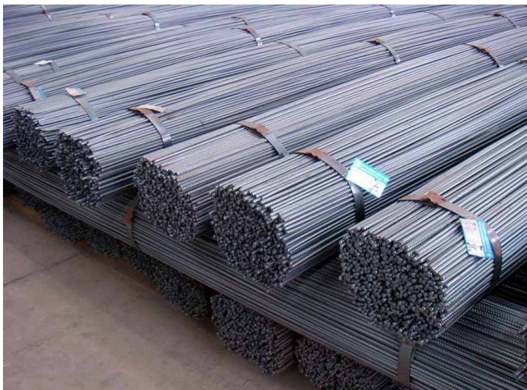
Figura 2 – Acciaio per c.a. opportunamente etichettato

L'acciaio deve essere qualificato all'origine, deve portare impresso, come prescritto dalle suddette norme, il marchio indelebile che lo renda costantemente riconoscibile e riconducibile inequivocabilmente allo stabilimento di produzione.